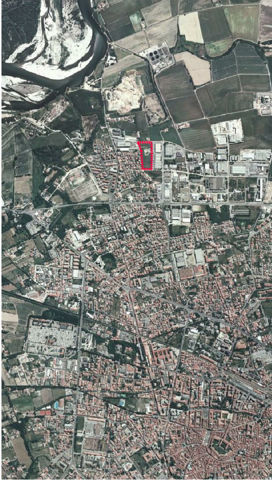
IDENTIFICAZIONE AEROFOTOGRAFICA