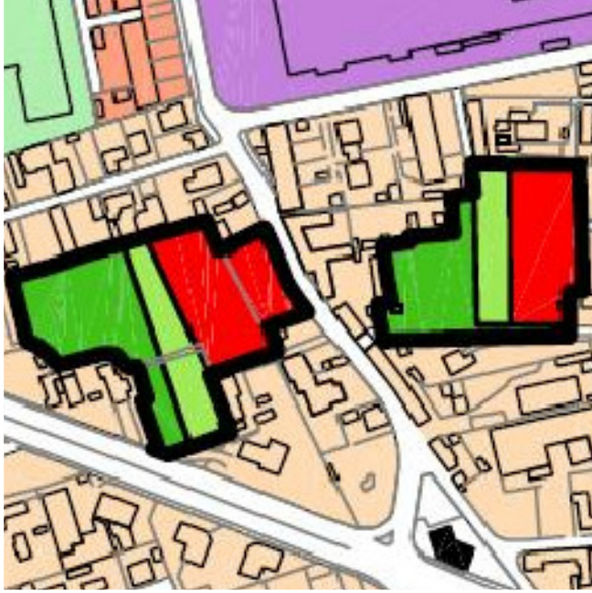
RIPARTIZIONE FUNZIONALE DA PRG