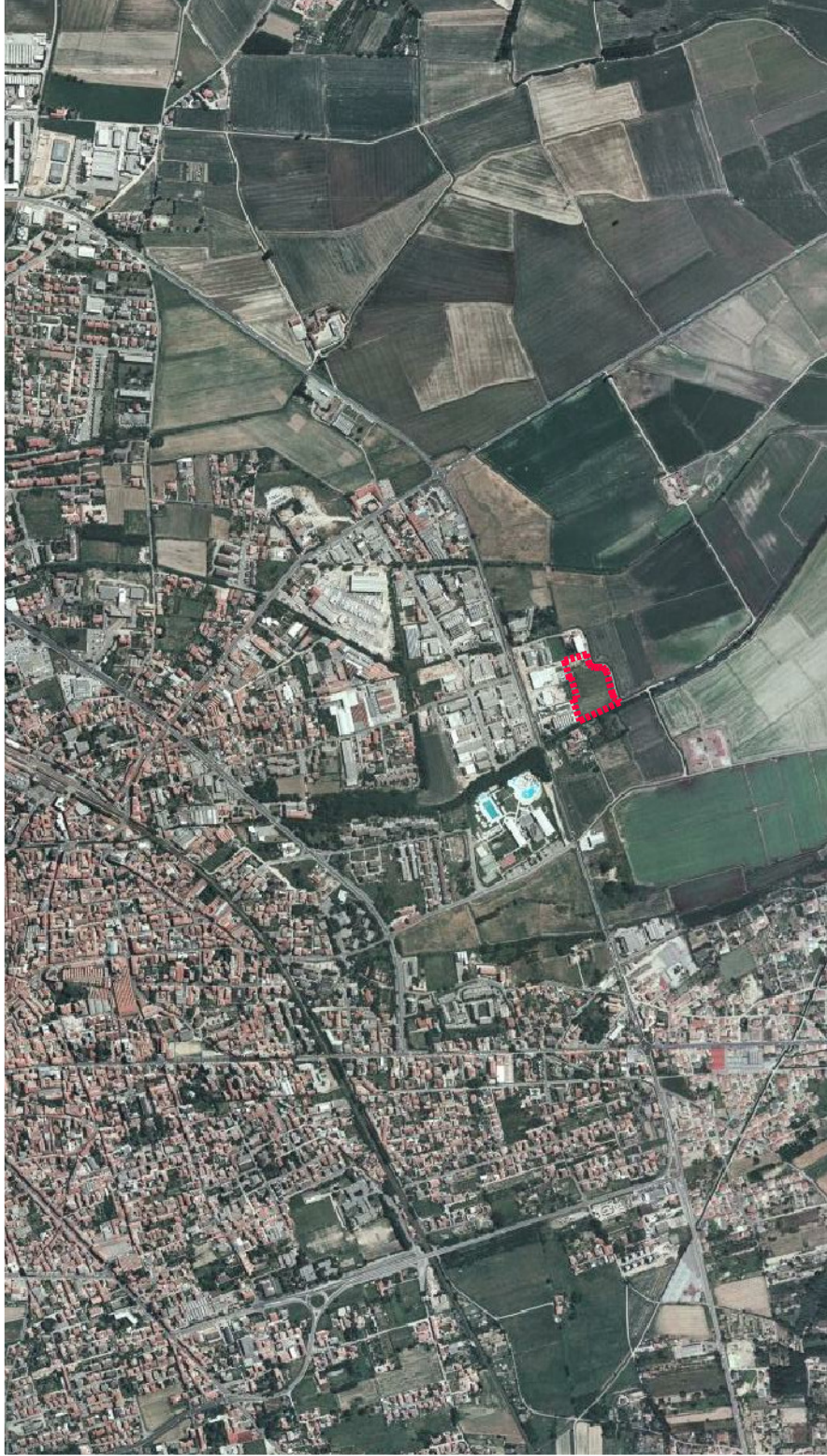
IDENTIFICAZIONE AEROFOTOGRAFICA