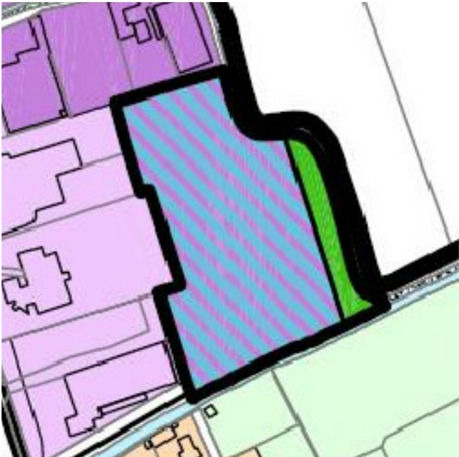
RIPARTIZIONE FUNZIONALE DA PRG