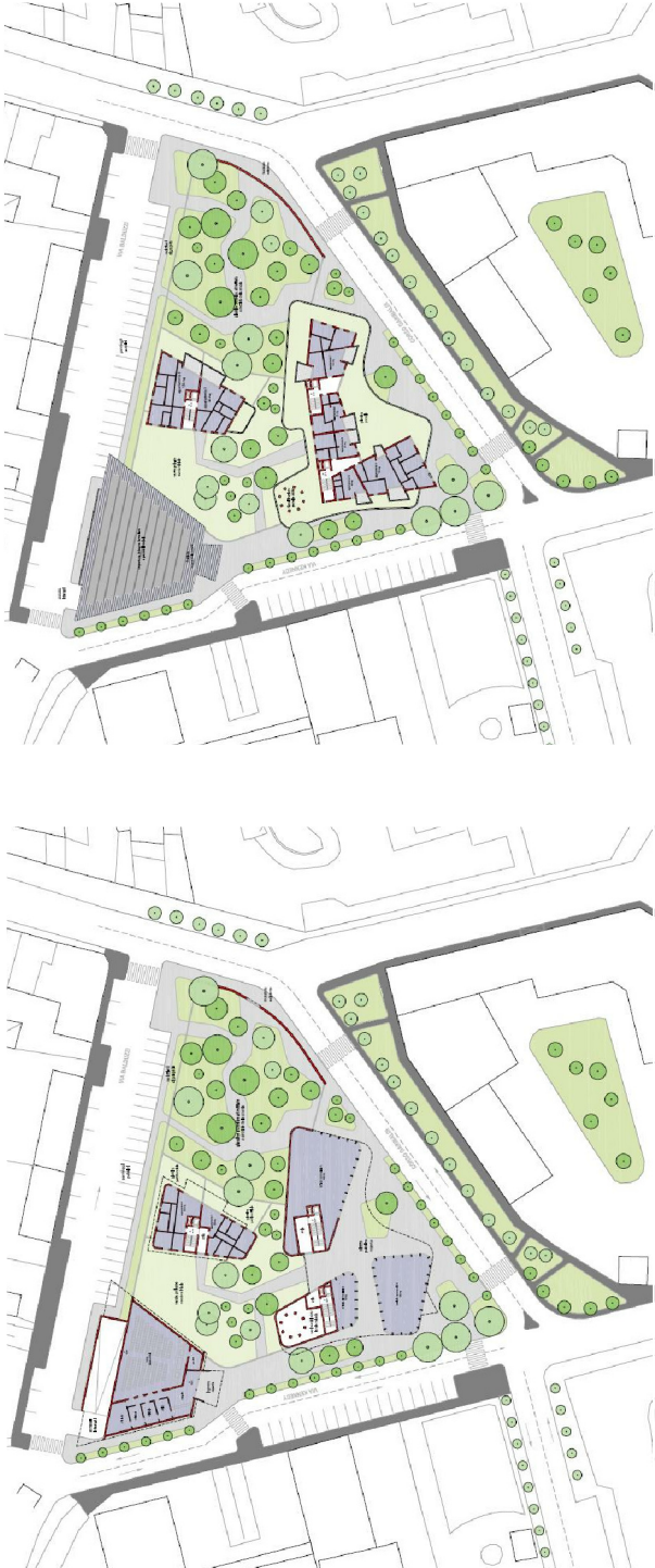
Estratto progettuale da proposta attuativa - piani terra