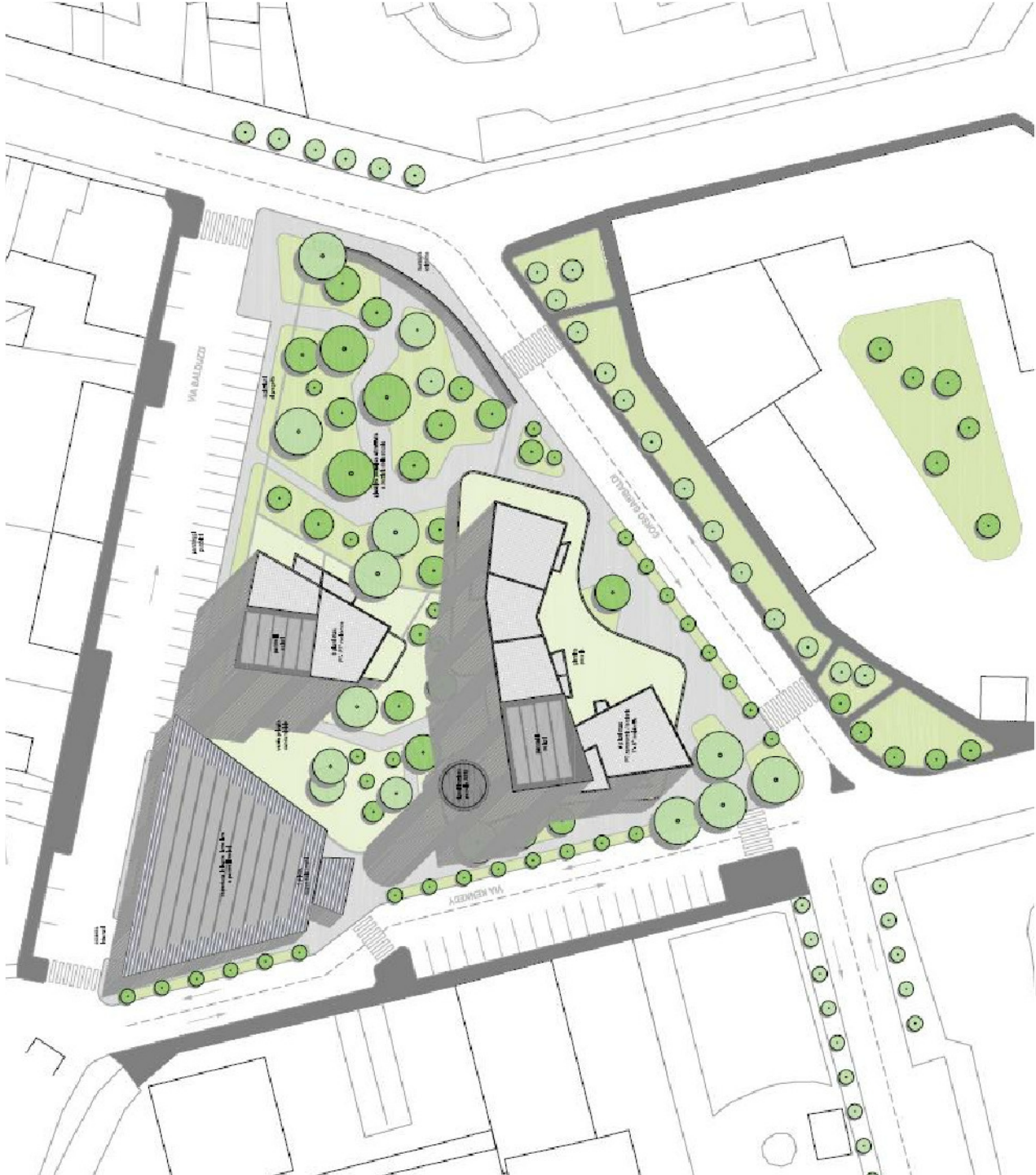
Estratto progettuale da proposta attuativa - planovolumeirico