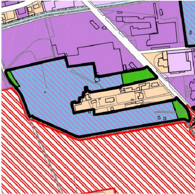
RIPARTIZIONE FUNZIONALE DA PRG