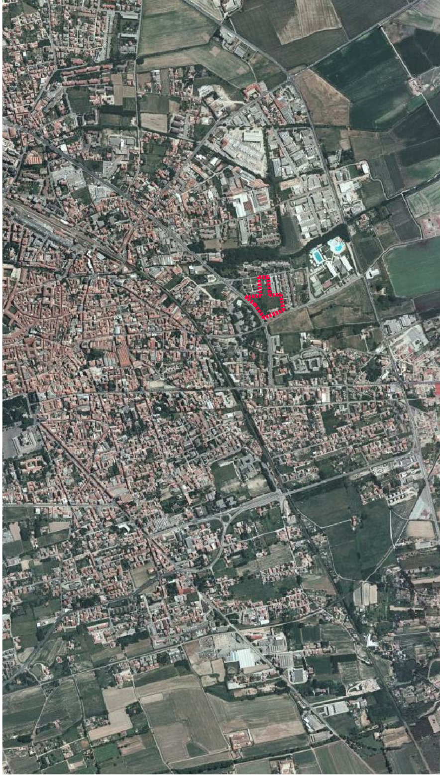
IDENTIFICAZIONE AEROFOTOGRAFICA