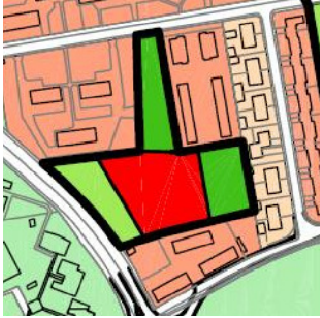
RIPARTIZIONE FUNZIONALE DA PRG