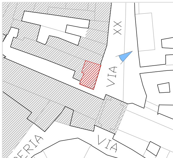
Inquadramento territoriale con cono di visuale fotografico