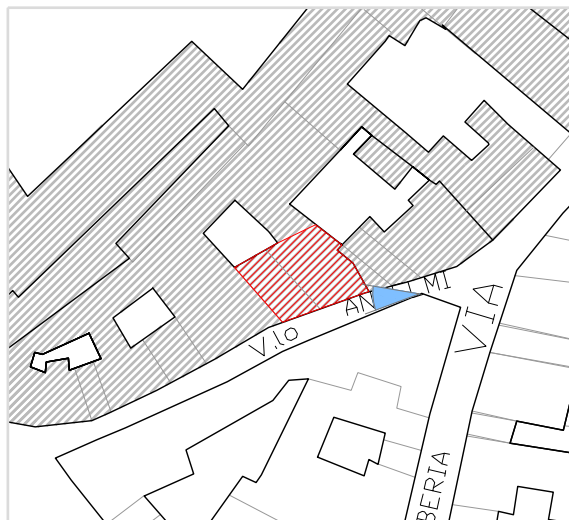
Inquadramento territoriale con cono di visuale fotografico