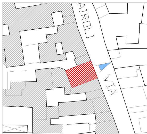
Inquadramento territoriale con cono di visuale fotografico