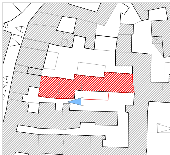
Inquadramento territoriale con cono di visuale fotografico