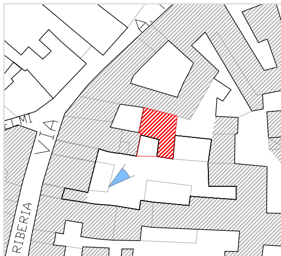
Inquadramento territoriale con cono di visuale fotografico