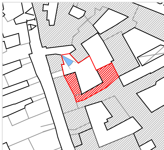
Inquadramento territoriale con cono di visuale fotografico