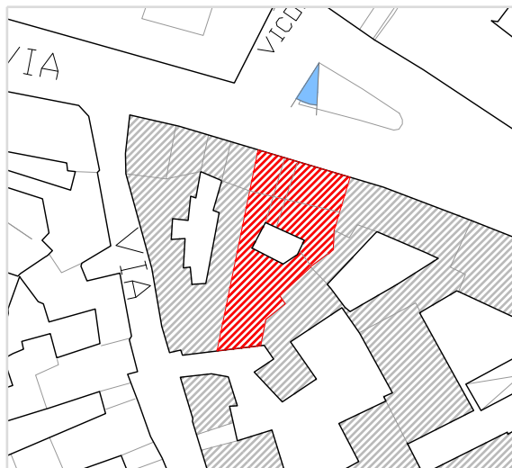
Inquadramento territoriale con cono di visuale fotografico