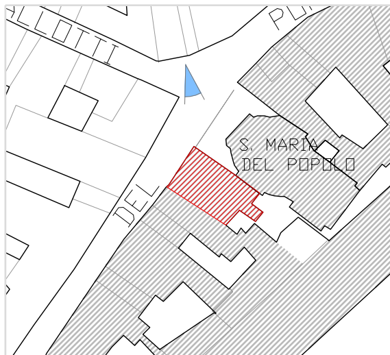
Inquadramento territoriale con cono di visuale fotografico