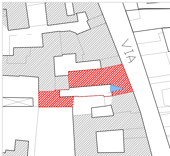
Inquadramento territoriale con cono di visuale fotografico