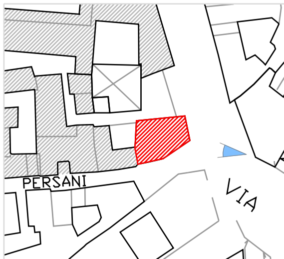
Inquadramento territoriale con cono di visuale fotografico