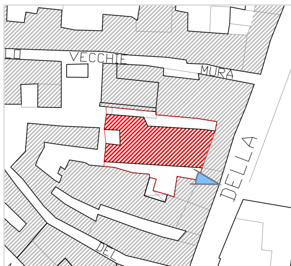
Inquadramento territoriale con cono di visuale fotografico