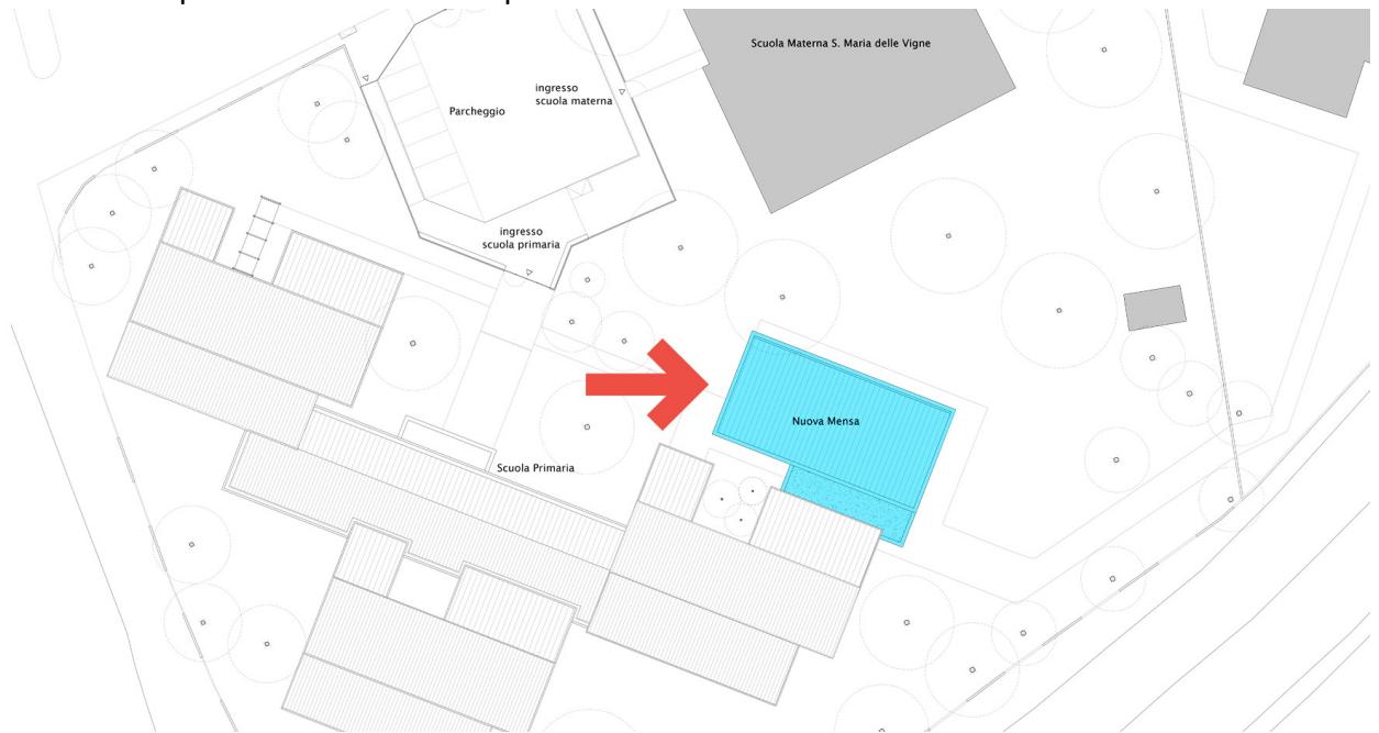
Posizionamento nuova mensa

L'intervento prevede la demolizione dell'attuale corpo che ospita il refettorio e gli spazi di servizio e la costruzione di un nuovo edificio adibito a mensa scolastica con servizi annessi. La necessità principale è quella di realizzare un'integrazione completa tra scuola e la nuova mensa per permettere ai bambini di utilizzare il nuovo spazio senza uscire all'aperto come avviene attualmente