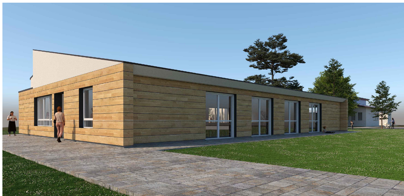
Vista da est

La scuola è situata in Via Santa Maria, 56