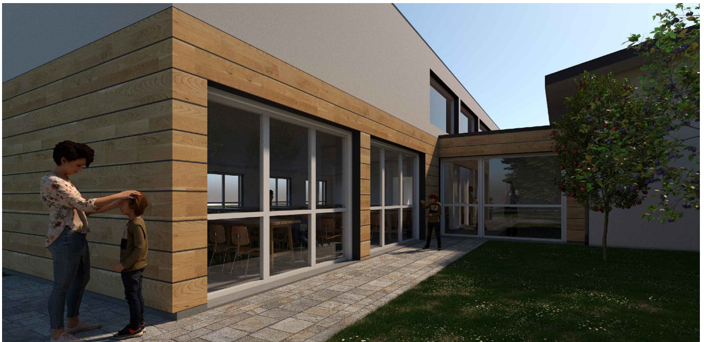
Vista dal patio tra la scuola e nuova mensa

L'elemento di collegamento che ospita il disimpegno e il nucleo servizi igienici per i bambini è pensato come una "cerniera" bassa con tetto piano. Il locale mensa ha invece una sezione con pendenza asimmetrica a unica falda, come tutte le coperture degli edifici originali, e una sezione più ampia di altezza media di 3.8 metri.