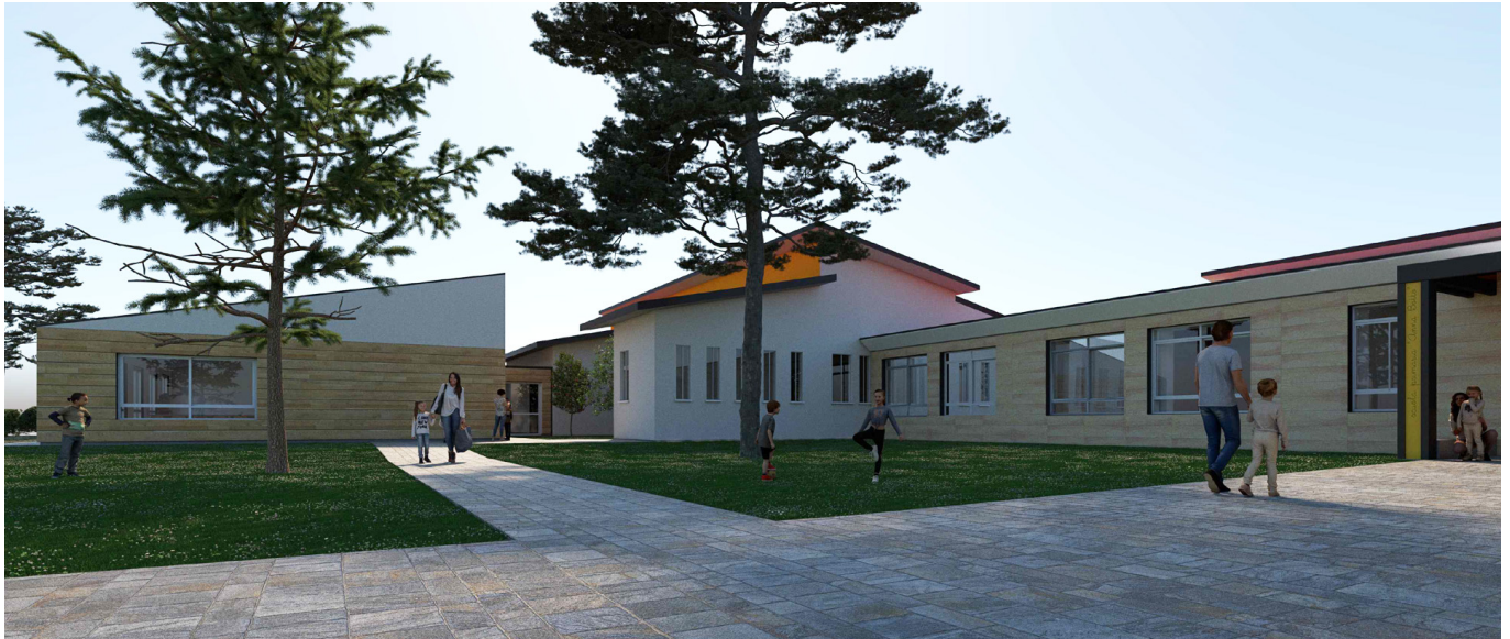
Vista dall'ingresso della scuola

Il nuovo edificio viene collocato in aderenza alla scuola primaria, appoggiandosi al fabbricato esistente in corrispondenza del nucleo aule: in questo modo, l'attuale spazio aperto tra l'aula 13 e il blocco servizi si trasforma in un patio a verde, aperto verso il giardino prospiciente il corpo di collegamento tra i tre blocchi che compongono l'edificio.