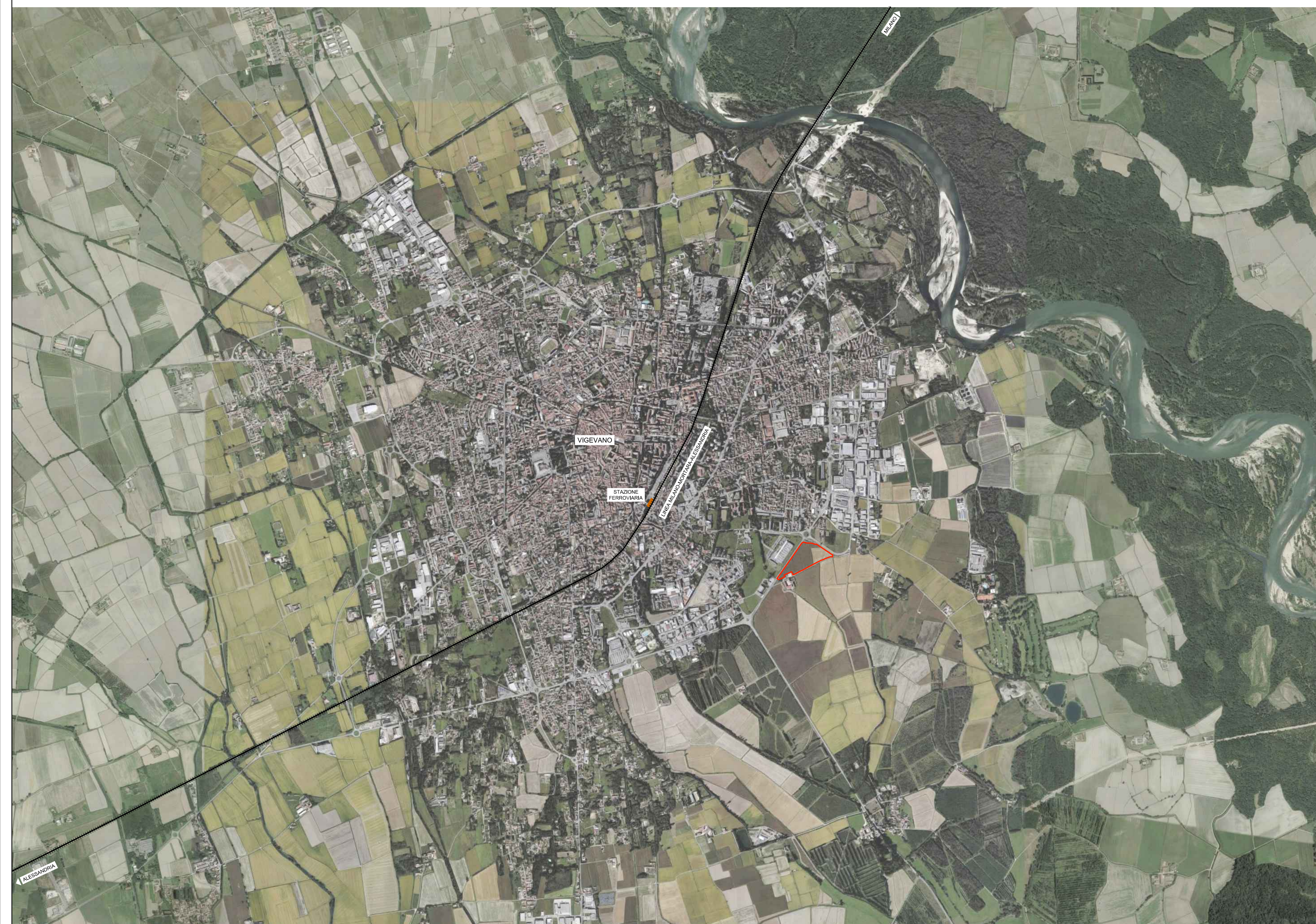
Fotopiano - Scala 1:20000