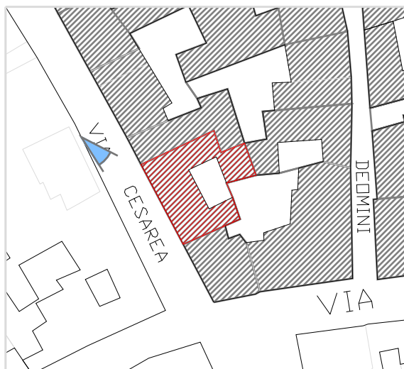
Inquadramento territoriale con cono di visuale fotografico