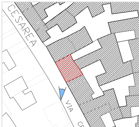
Inquadramento territoriale con cono di visuale fotografico