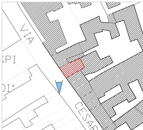
Inquadramento territoriale con cono di visuale fotografico