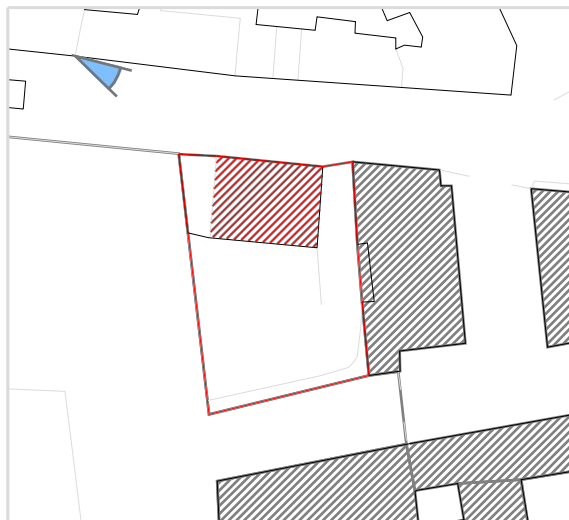
Inquadramento territoriale con cono di visuale fotografico