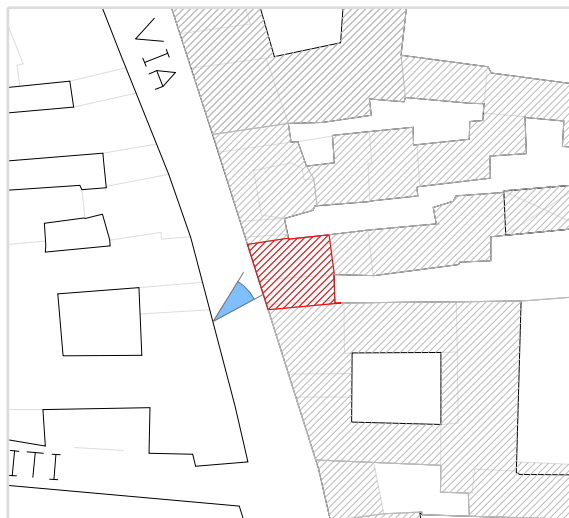
Inquadramento territoriale con cono di visuale fotografico