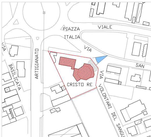
Inquadramento territoriale con cono di visuale fotografico