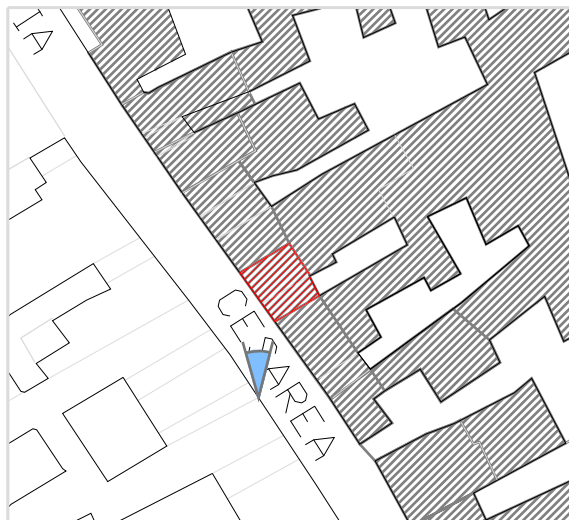
Inquadramento territoriale con cono di visuale fotografico