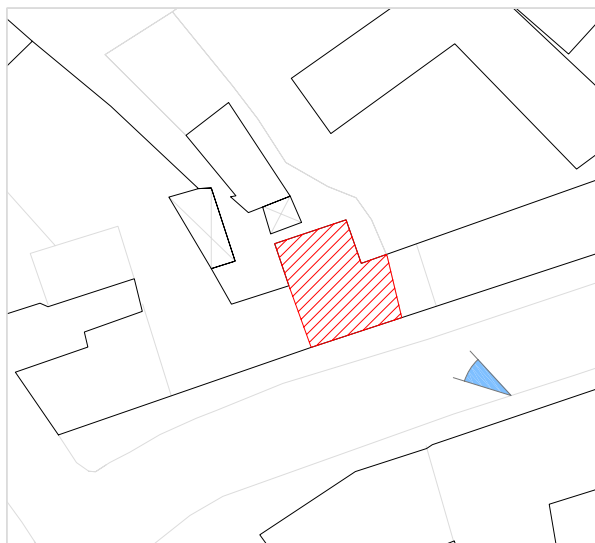
Inquadramento territoriale con cono di visuale fotografico