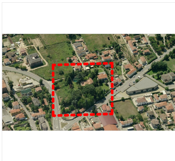
estratto da http://local.live.it