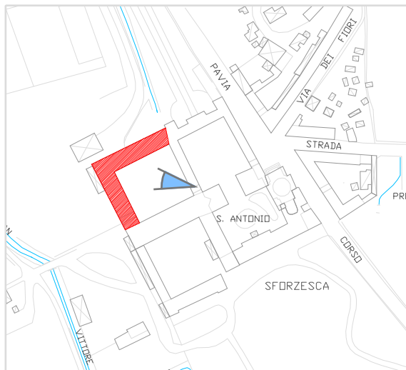
Inquadramento territoriale con cono di visuale fotografico